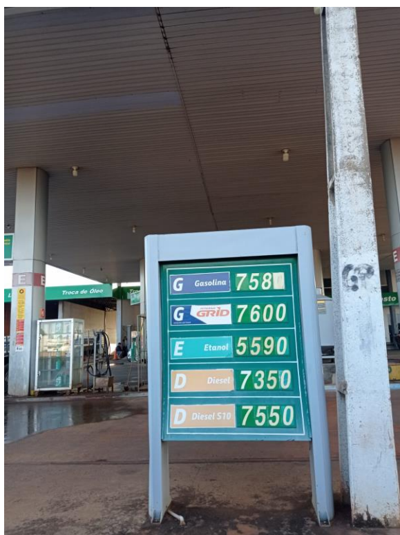
AUTO POSTO MARTINI LTDA (CNPJ 10.590.296/0001-00)