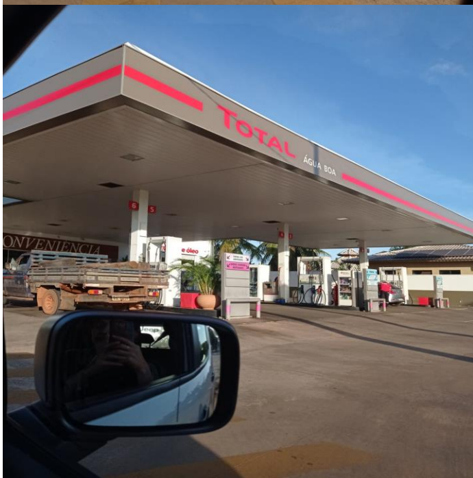
AUTO POSTO AGUA BOA LTDA (CNPJ 18.022.755/0001-52)