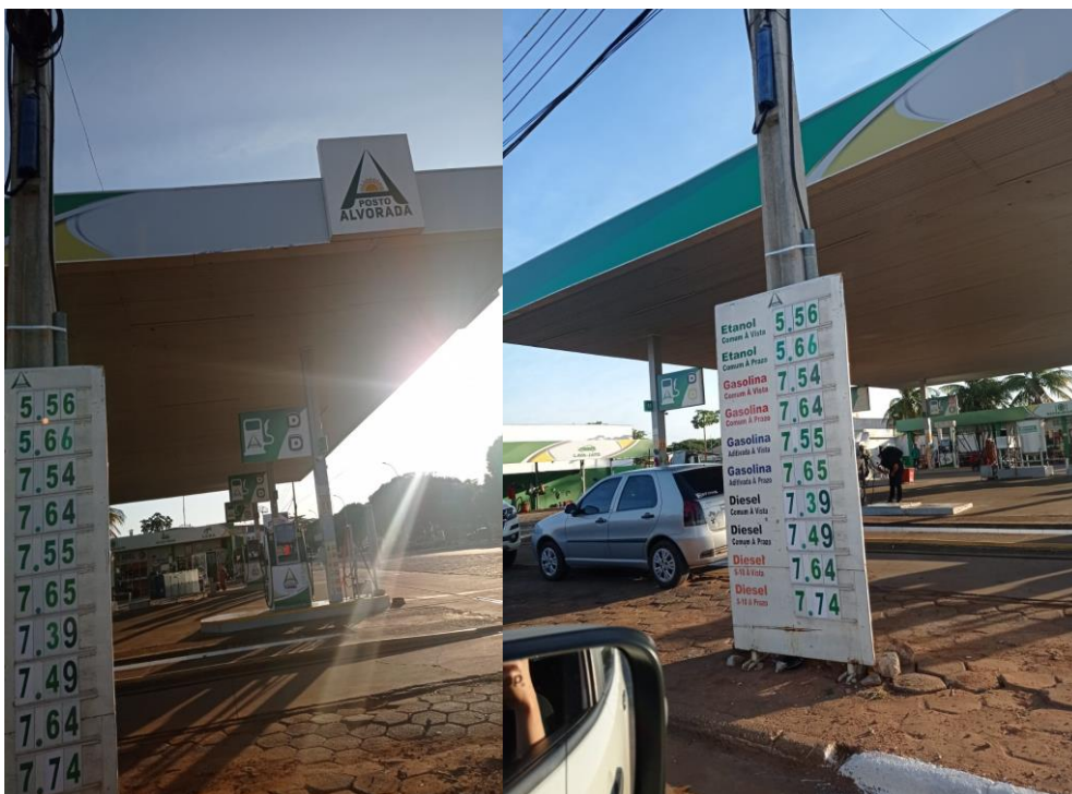
BIAVATTI & CIA LTDA (CNPJ 01.289.412/0002-37)