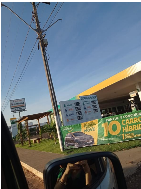
AUTO POSTO MARTINAO LTDA (CNPJ 26.542.308/0001-52)